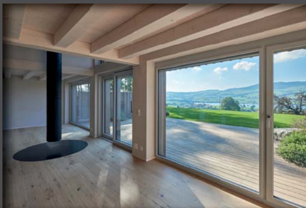
Lutz Architectes / Corinne Cuendet, Clarens