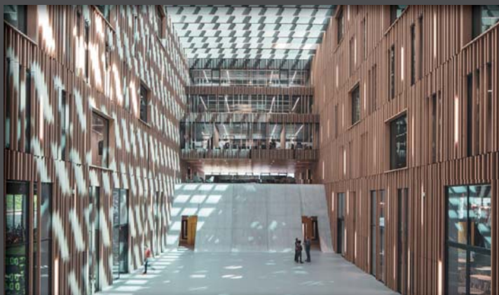
Itten+Brechbühl AG, Bern